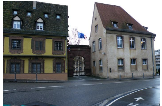
Eingang „portail d'honneur“